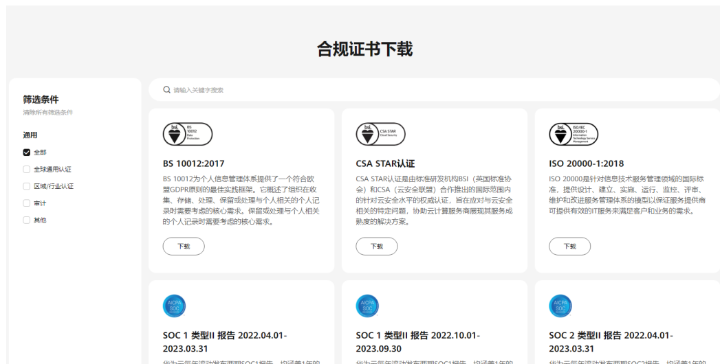
图 7-2 合规证书下载

华为云服务及平台通过了多项国内外权威机构（ISO/SOC/PCI等）的安全合规认证，用户可自行 申请下载 合规资质证书。