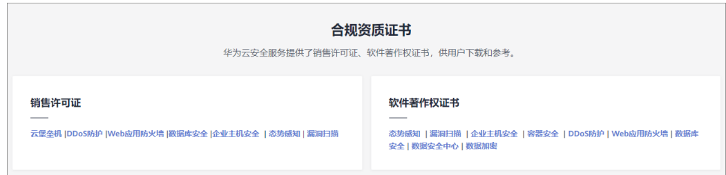
图 7-4 销售许可证&软件著作权证书

另外，华为云还提供了以下销售许可证及软件著作权证书，供用户下载和参考。具体请查看 合规资质证书 。