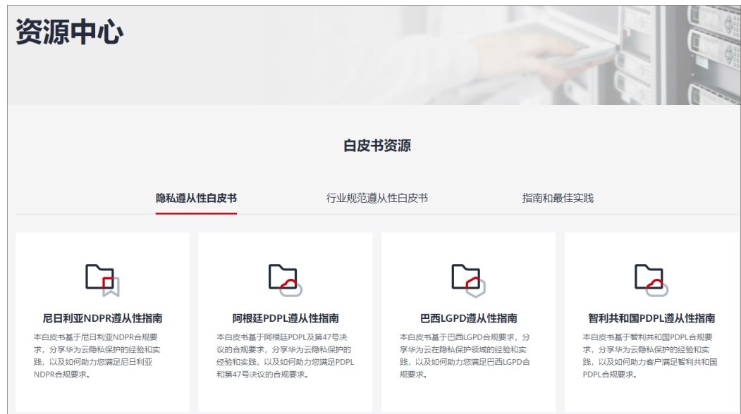
图 7-3 资源中心